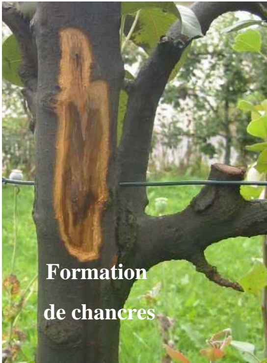
Formation de chancres

Conservation de la bactérie dans les chancres